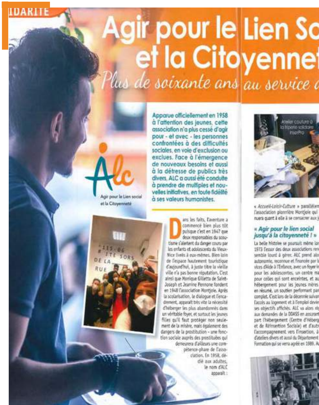
* ALC : MISSIONS ET HISTOIRE